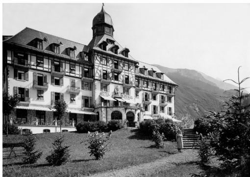
Kurhaus Bergün (Ansicht)