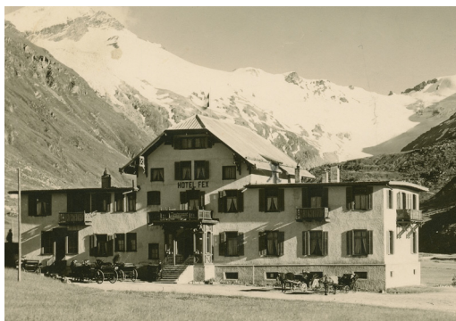
Hotel Fex im Fexthal

Nach dem Frühstück fahren wir mit der Kutsche ins Fexthal, wo wir in Fex-Cresta die um 1500 erbaute Kapelle besuchen, ein einfacher Rechteckbau mit halbrundem Chor und wertvollen Malereien. Anschliessend geniessen wir einen Kaffee im nahegelegenen Hotel Fex, wiederum ein Mitglied von Swiss Historic Hotels. Dann fahren wir zurück und besuchen Maloja. Wir machen dort Halt beim alten Grand Hotel und besuchen das Wohnhaus und Atelier von Giovanni Segantini. Unsere heutige Endstation ist Soglio, wo uns ein Hotelrundgang im Palazzo Salis erwartet mit anschliessendem Nachtessen und Übernachtung.