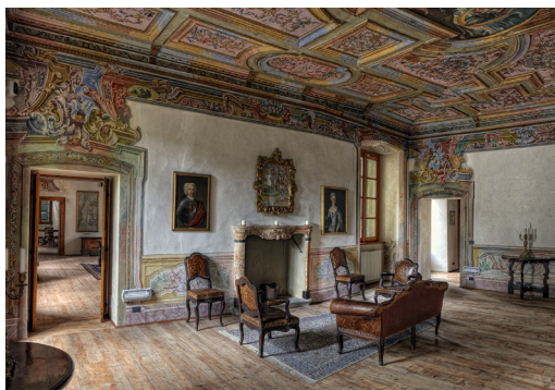
Museum Palazzo Salis (Saal der Vielfarbendecke)

Am letzten Reisetag führt uns das Postauto zurück nach Promontogno, wo wir in Bondo den barocken Palazzo der Familie Salis besuchen können. Dann treffen wir uns im Hotel Bregaglia, ein Bau von Architekt Giovanni Sottovia, um das Mittagessen einzunehmen. Zum Abschluss fahren wir zurück nach St. Moritz wo unsere Reise endet.