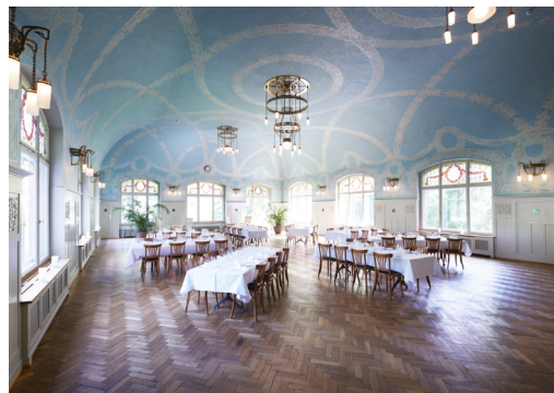
Kurhaus Bergün (Saal)