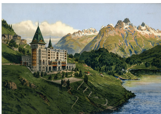
Badrutts Palace St. Moritz

Après le petit-déjeuner, nous prendrons le car postal alpin FBW pour traverser le col de l'Albula et nous rendre en Engadine. Nous y visiterons d'abord l'hôtel Crusch Alva à Zuoz, où nous allons dîner également. Après une pause-café au Badrutts Palace de St-Moritz, nous visiterons cet établissement historique sous la conduite d'un guide compétent et pourrons jeter un coup d'œil dans les coulisses. Nous poursuivrons ensuite notre voyage en car postal jusqu'à Sils et l'hôtel Waldhaus. Cet hôtel Swiss Historic sera également visité sous la conduite d'un guide compétent, y compris le petit musée de l'hôtel. Après le dîner dans les salles historiques, nous y passerons la nuit.