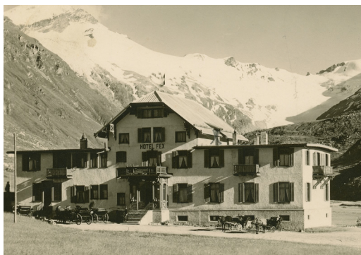
Hôtel Fex à Fexthal

Après le petit-déjeuner, nous partons en calèche dans la vallée de Fex, où nous visitons à Fex-Cresta la chapelle construite vers 1500, une simple construction rectangulaire avec un chœur semi-circulaire et des peintures de grande valeur. Nous profitons ensuite d'un café à l'hôtel Fex tout proche, à nouveau membre de Swiss Historic Hotels. Nous repartons ensuite pour visiter Maloja. Nous nous arrêtons à l'ancien Grand Hôtel et visitons la maison et l'atelier de Giovanni Segantini. Notre terminus du jour est Soglio, où nous attend une visite de l'hôtel Palazzo Salis, suivie d'un dîner et d'une nuit.