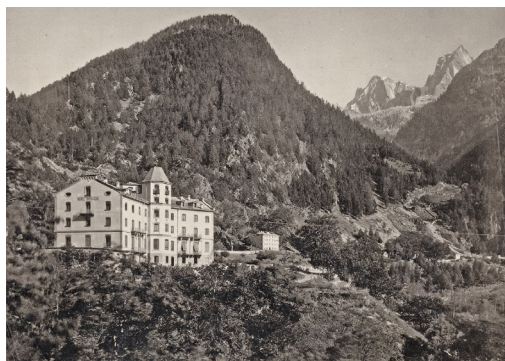
Hotel Bregaglia Promontogno