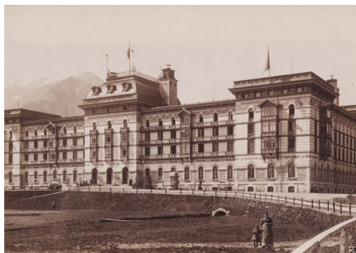
Grand Hotel Maloja (1886)