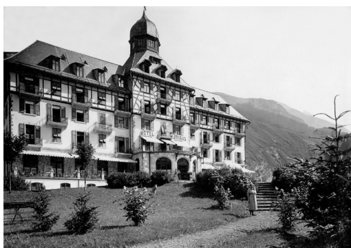
Kurhaus Bergün (Vue)