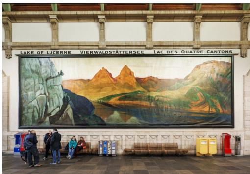
Hall de la gare de Bâle

Rendez-vous dans l'ancien hall des guichets de la gare CFF de Bâle.