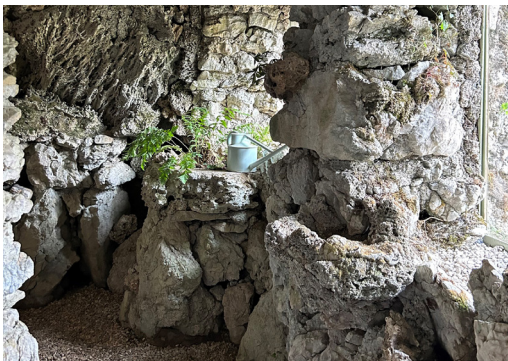
Volière © René Koelliker

Au cœur du paysage sauvage et romantique du canton du Jura, une impressionnante variété de plantes vivaces est cultivée avec un grand dévouement. Bienvenue à La Cousterie ! Une visite du jardin nous permet d'en apprendre davantage sur l'histoire et les particularités de ce lieu unique. Nous découvrons également une rare grotte «cage à oiseaux» , un joyau d'antan.