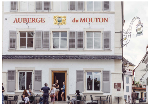
Auberge du Mouton

Après la visite, il est possible de faire une randonnée facile à travers les pâturages boisés typiques du Jura jusqu'à Grandval. Vous pouvez également faire le trajet en bus postal historique. Là, nous visitons la plus ancienne ferme du Jura bernois, la Maison du Banneret Wisard , et dégustons une petite collation.