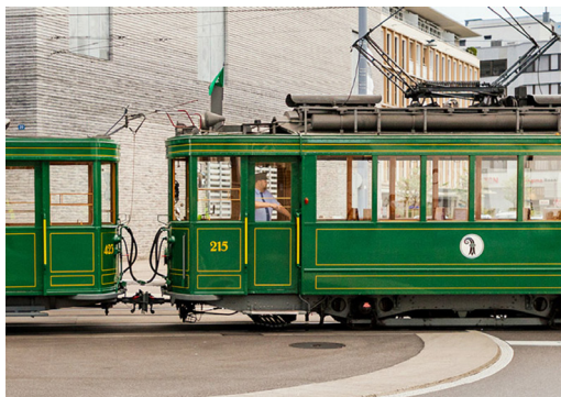
Voiture ancienne

De la gare, nous partons pour une agréable promenade vers notre premier point fort culturel et humons ainsi nos premières impressions de la ville culturelle aux multiples facettes qu'est Bâle. Ensuite, nous continuons à travers la ville en tramway historique. Après le trajet, nous sommes attendus à l' hôtel Krafft (Swiss Historic Hotel) – un établissement de charme et chargé d'histoire situé directement sur le Rhin.