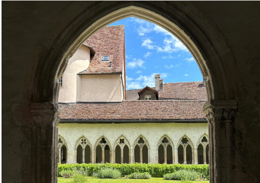
Collégiale catholique romaine Saint-Ursanne

Après le petit-déjeuner, nous prenons le bus postal historique pour nous rendre à St-Ursanne. Nous y faisons une visite guidée de la collégiale et de la charmante vieille ville jusqu'au Jardin de la Cousterie .