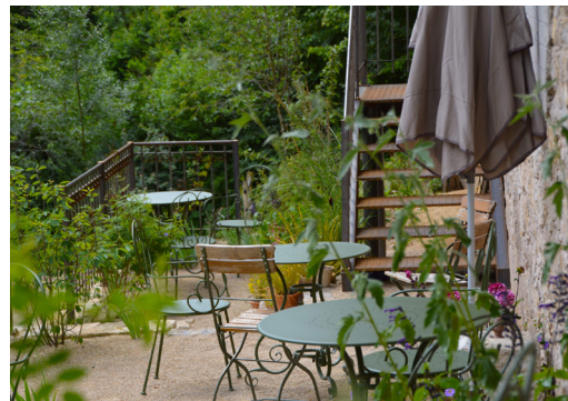
Café du jardin

Après la visite et une petite collation, le voyage se poursuit jusqu'à Delémont, capitale du canton du Jura ou notre voyage se termine vers 16h00 à la gare.