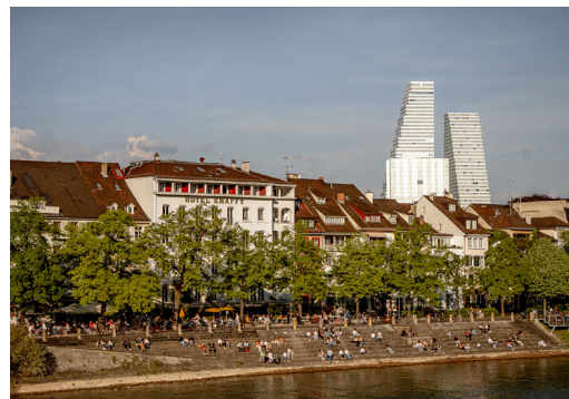
Hotel Krafft