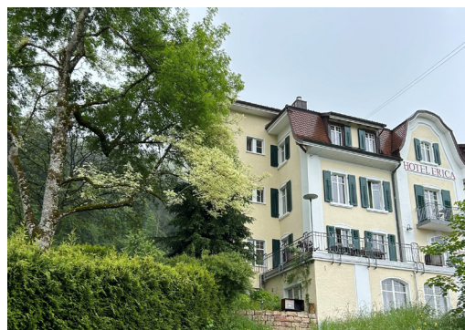
Hotel Erica © René Koelliker