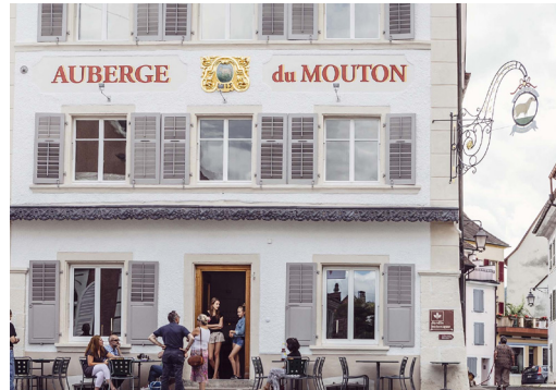
Auberge du Mouton

Am Nachmittag Weiterfahrt nach Porrentruy, Zimmerbezug in der Auberge du Mouton (Swiss Historic Hotel). Der Rest des Nachmittags bietet Zeit zur freien Verfügung sowie eine Führung durch Porrentruy, bevor der Tag mit einem gemeinsamen Abendessen ausklingt.