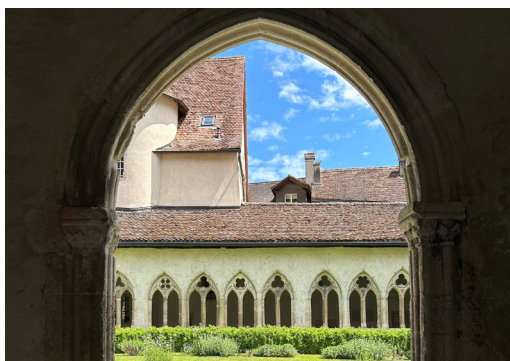
Saint-Ursanne Kloster

Nach dem Frühstück fahren wir mit dem historischen Bus nach St-Ursanne. Dort erwartet uns eine Führung durch die beeindruckende Kollegialkirche und die charmante Altstadt bis zum Jardin de la Cousterie .