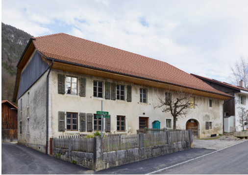
Ferme Joray

Nach dem Frühstück fahren wir mit einem historischen Bus von Langenbruck nach Belprahon. Dort erhalten wir eine exklusive Führung über die Baustelle der Ferme Joray – ein historisches Bauernhaus, das ab 2027 Teil des Angebots der Stiftung Ferien im Baudenkmal sein wird.