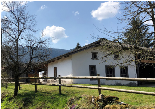
Maison du Banneret Wisard © René Koelliker

Im Anschluss besteht die Möglichkeit zu einer leichten Wanderung durch die typischen jurassischen Wytweiden bis nach Grandval. Alternativ kann die Strecke auch bequem mit dem Bus zurückgelegt werden. Hier besuchen wir das älteste Bauernhaus des Berner Jura, das Maison du Banneret Wisard , und geniessen einen kleinen Imbiss.