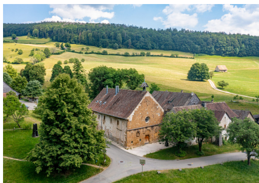
Monastère de Schönthel

De retour de notre balade, nous nous installons à l' hôtel Erica (Swiss Historic Hotel). En fin d'après-midi, une conférence sur les voyages au 18e siècle nous attend, suivi d'un repas du soir pris en commun.