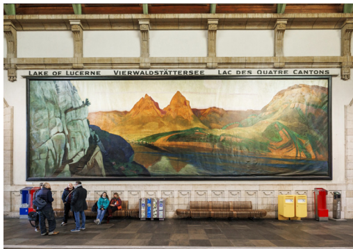
Hall de la gare de Bâle

Rendez-vous dans l'ancien hall des guichets de la gare CFF de Bâle.